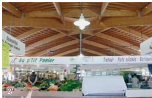
2/ Halle du Marché de Dreux, le bois lamellé répond, ici, parfaitement aux exigences sanitaires d'un marché. Architecte : Gülgönen - Cabinet APRAH.