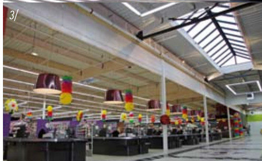
1/ Le pôle commercial de la ville des Herbiers, en Vendée. Maître d'œuvre : ACROPA