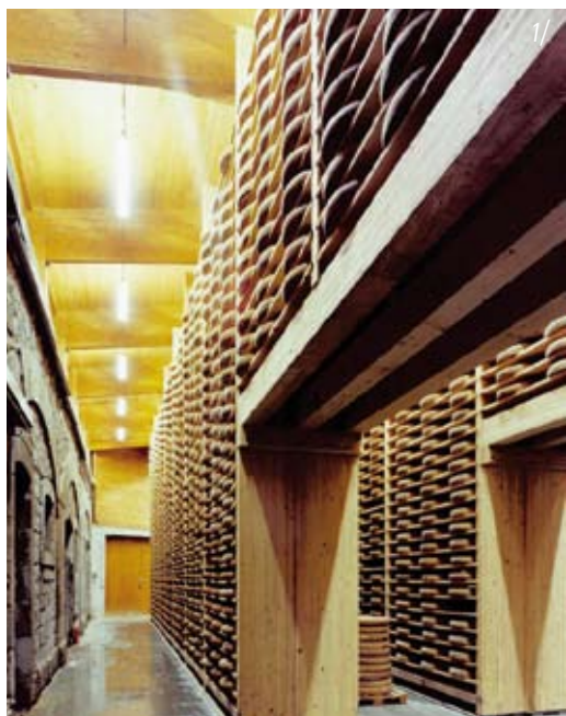
1/ Cave d'affinage du Comté Marcel PETITE dans l'est de la France, réalisée avec une structure en bois lamellé. Architecte : Denis VANNOZ

Le bois lamellé a été l'un des premiers matériaux à disposer, dès 2003, d'une Fiche de Déclarations Environnementales et Sanitaires (FDES, disponible sur le site www.inies.fr ). Cette fiche, réactualisée en 2009, prouve que le bois lamellé répond parfaitement aux attentes impulsées par une politique sanitaire exigeante. Dans cette perspective, les produits de préservation, de finition et les adjuvants qui entrent dans la fabrication du bois lamellé ont largement évolué au cours de la dernière décennie, en conformité avec les réglementations françaises et européennes (REACH, Biocides...) Ces produits sont soumis à des évaluations de toxicité (Tox et Ecotox) excluant les solvants organiques. La certification CTB P+ atteste de leur innocuité pour l'environnement et la santé humaine.